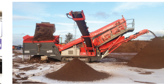
Straordinarie capacità di stoccaggio