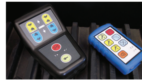
Due velocità di spostamento e radiocomando