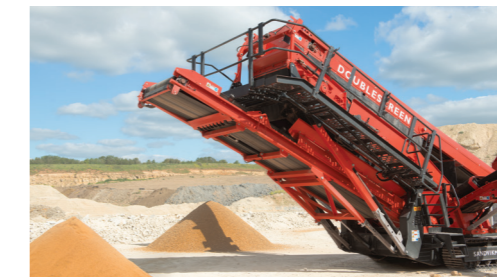
Passerella con ripiegamento su tre lati in prossimità del nastro principale