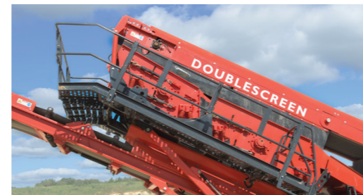
Tecnologia Doublescreen a due piani brevettata