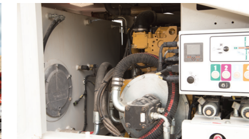
Impianto idraulico ad elevata efficienza e giri/min ridotti per un basso consumo di carburante