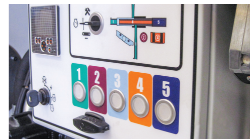
Pannello di comando con codice colore per un'estrema facilità d'uso